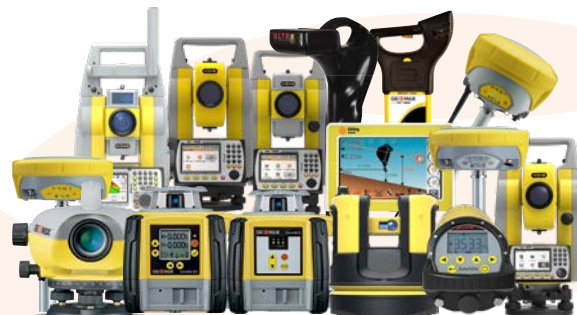
Авторизованный партнер GEOMAX